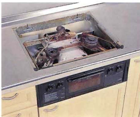
従来品は器具内がボロボロに…

このコーナーでは、知っているようで意外に知られていないことを紹介させていただきます☆