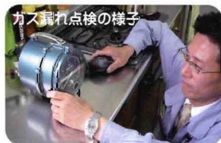
ガス漏れ点検の様子

お客様の快適な生活、そして時には命まで関わる事です。ので、いつも間違いや漏れがないように、真剣勝負です！