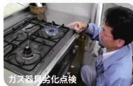
ガス器具劣化点検

法令によりガスを供給しているお宅には4年以内に1回は定期保安点検を実施するよう定められております。ニシダガスセンターではガス漏れ検査やガス器具、ガス配管の劣化点検はもちろんですが、写真での設備管理やガス管サビ止め液を塗布など独自の安全サービスも実施させていただいております！もちろん有資格者が点検にまわらせてもらっているのでご安心ください！