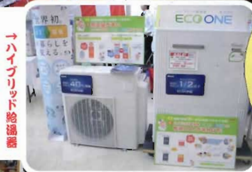
→ハイブリッド給湯器