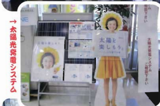
→太陽光発電システム