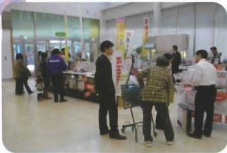
最新のガスコンロに奥様方は興味津々で説明を聞いておられました (^.^)