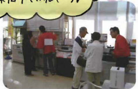
キッチンや浴室のリフォームのご相談もいただいております (^.^)