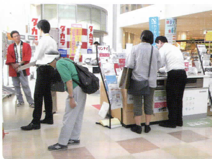
↑いつも「ガラストップコンロ」は人気ですね～(^.^)☆