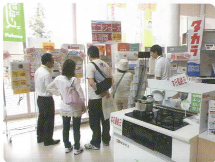
↑低燃費ガス給湯器「エコジョーズ」を半額にて展示(^^)